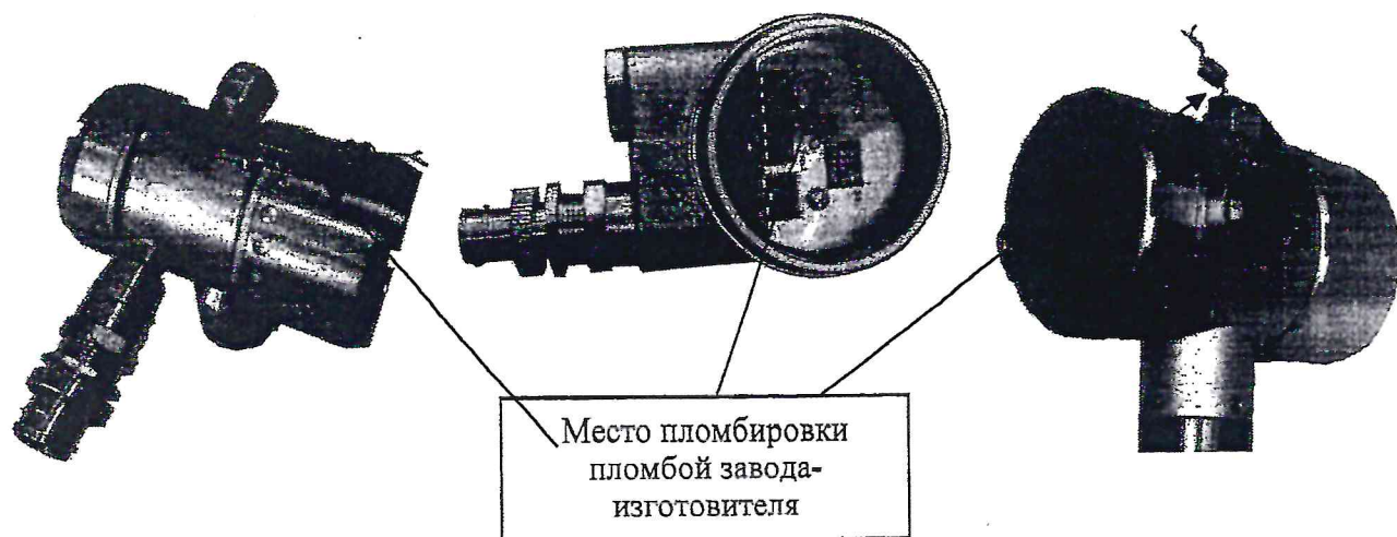
Рисунок 2 – Схема пломбировки электронного блока преобразователя от несанкционированного доступа, обозначение мест пломбировки пломбами завода-изготовителя