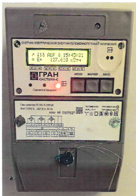
Рисунок 1.2 – Фотографии счётчиков, входящих в состав измерительных каналов АСКУЭ (изображения носят иллюстративный характер)