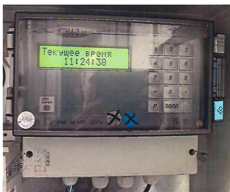
б) сумматор в шкафу АСКУЭ