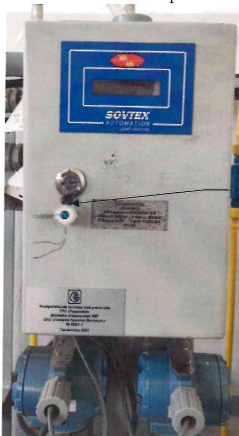
Схема пломбировки от несанкционированного доступа

Место пломбировки от несанкционированного доступа