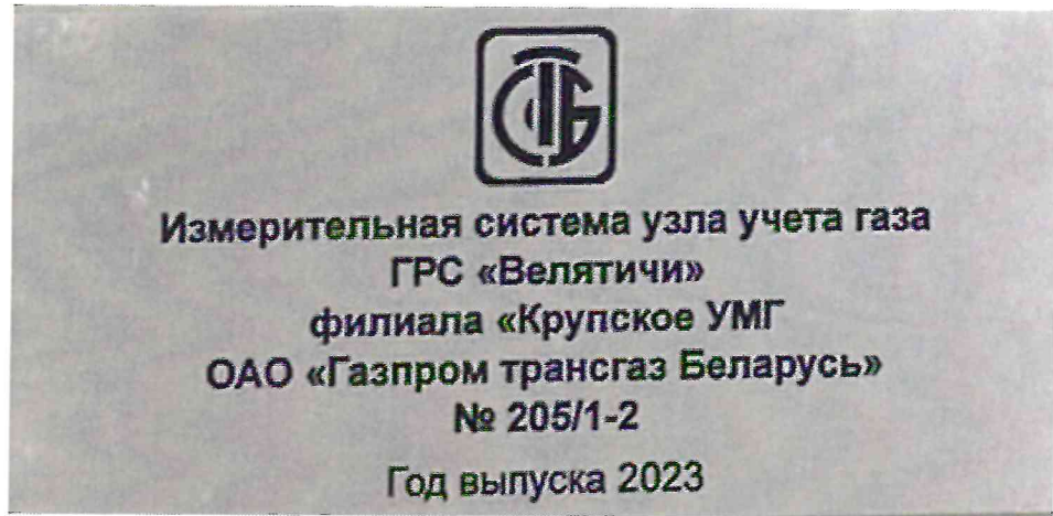
Рисунок 1.2 – Фотография маркировки ИС УУГ