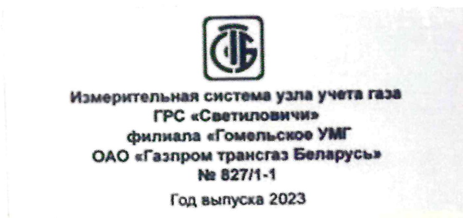
Рисунок 1.2 – Фотография маркировки ИС УУГ