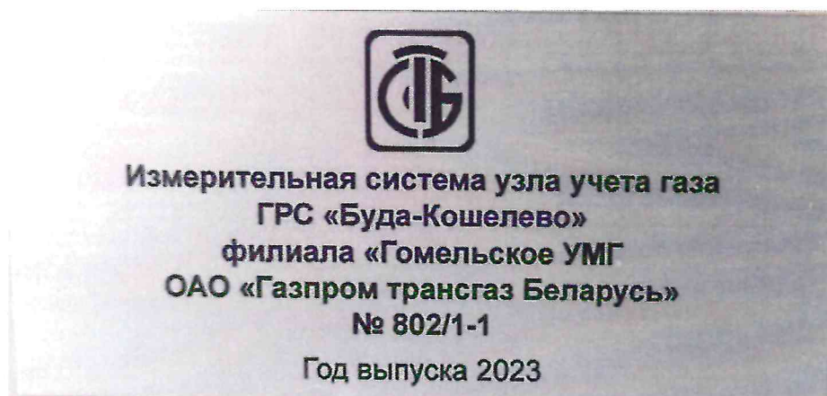
Рисунок 1.2 – Фотография маркировки ИС УУГ