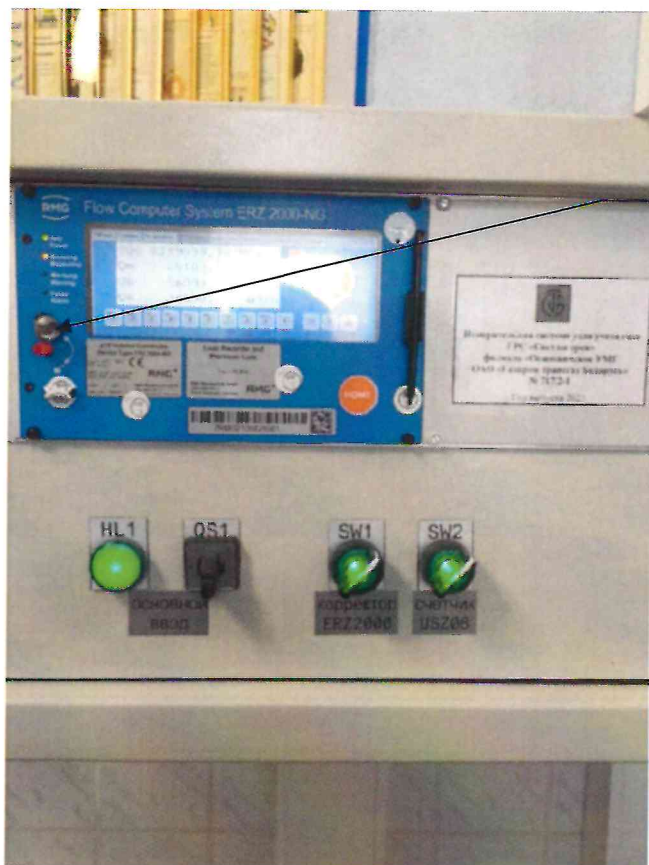
Место пломбировки от несанкционированного доступа