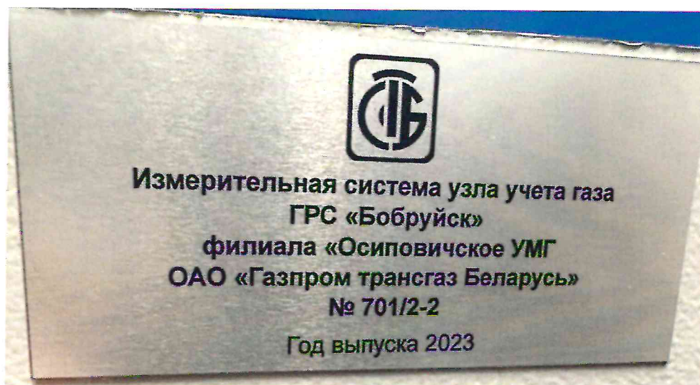
Рисунок 1.2 – Фотография маркировки ИС УУГ