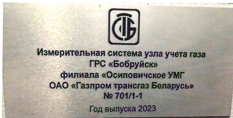
Рисунок 1.2 – Фотография маркировки ИС УУГ