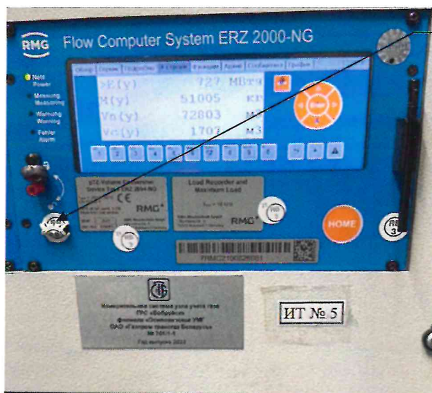
Схема пломбировки от несанкционированного доступа

Место пломбировки от несанкционированного доступа