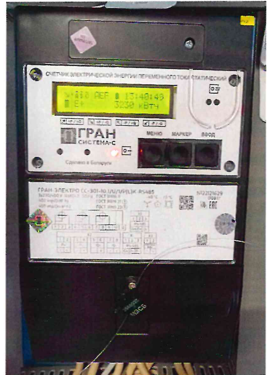
Рисунок 1.2 – Фотографии счётчиков, входящих в состав измерительных каналов АСКУЭ (изображения носят иллюстративный характер)