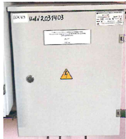
а) шкаф АСКУЭ