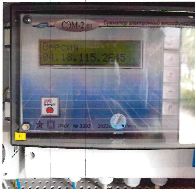
б) сумматор в шкафу АСКУЭ