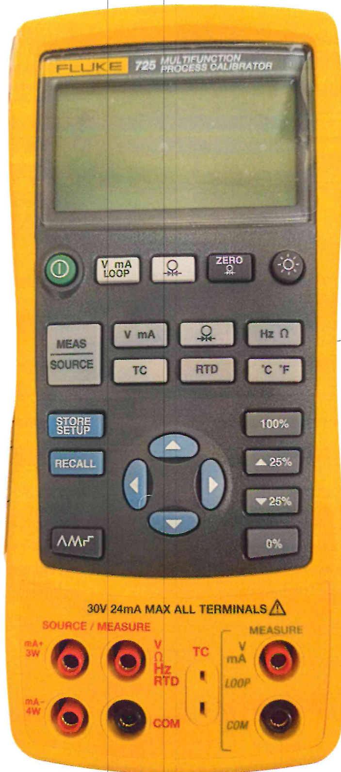
Рисунок 1.1 – Фотография общего вида калибратора процессов многофункционального Fluke 725 № 30790012WS