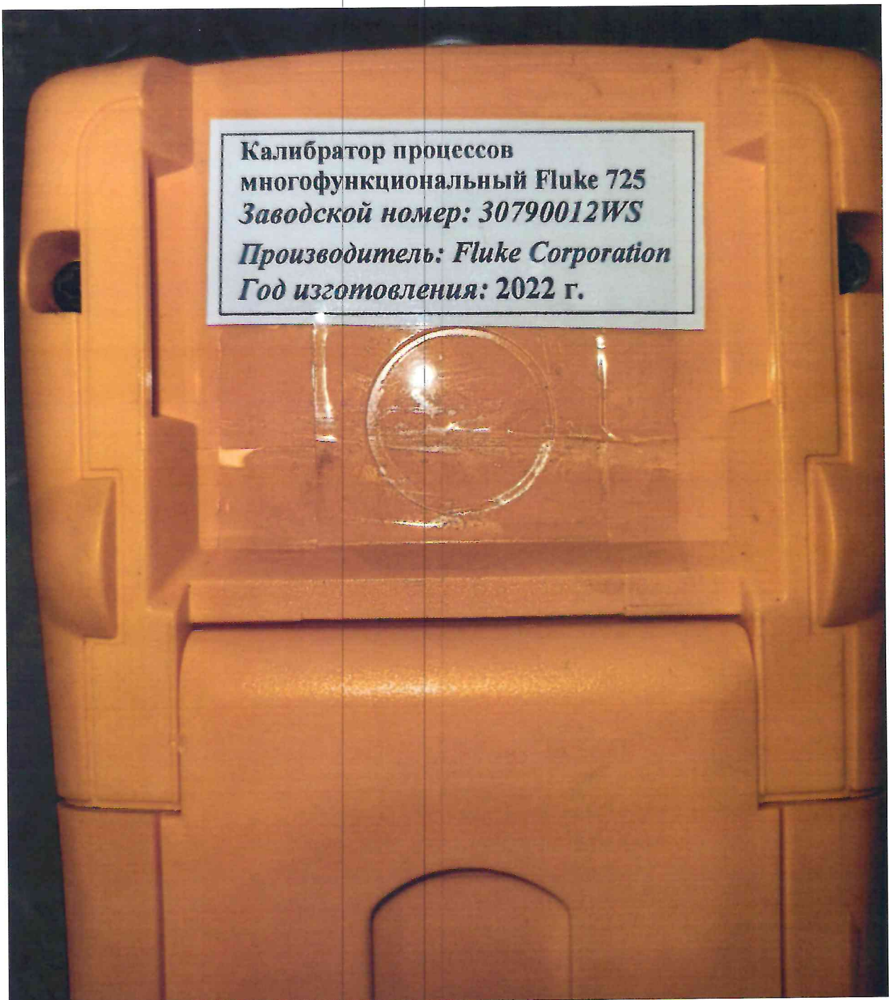
Рисунок 1.2 – Фотография маркировки калибратора процессов многофункционального Fluke 725 № 30790012WS