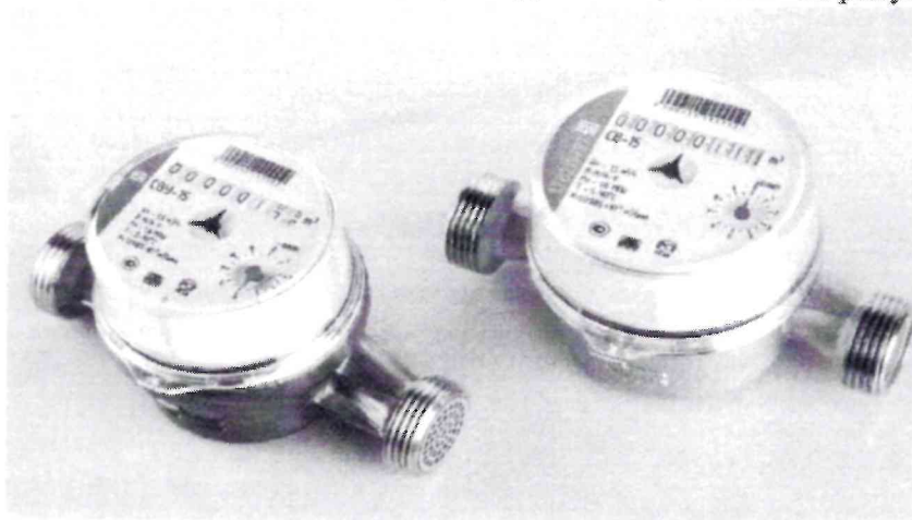
Рисунок 1- Счетчики холодной и горячей воды крыльчатые СВ, отличающиеся дизайном

Счетчики допускают горизонтальную и вертикальную установку на трубопроводе. Внешний вид счетчиков, отличающихся дизайном, показан на рисунке 1.