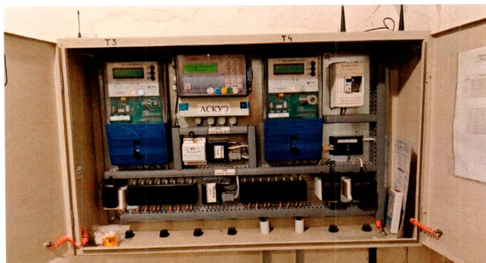
б) сумматор и счётчики в шкафу АСКУЭ