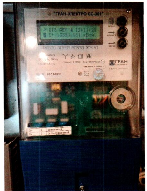
Измерительный канал № 2