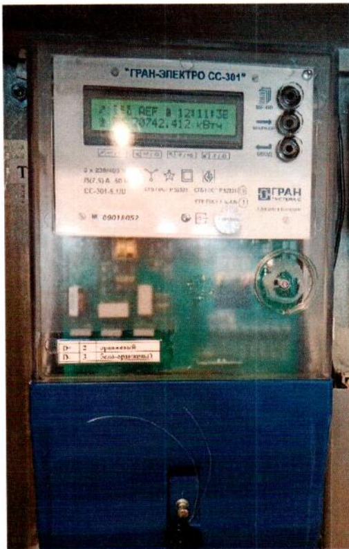
Измерительный канал № 1