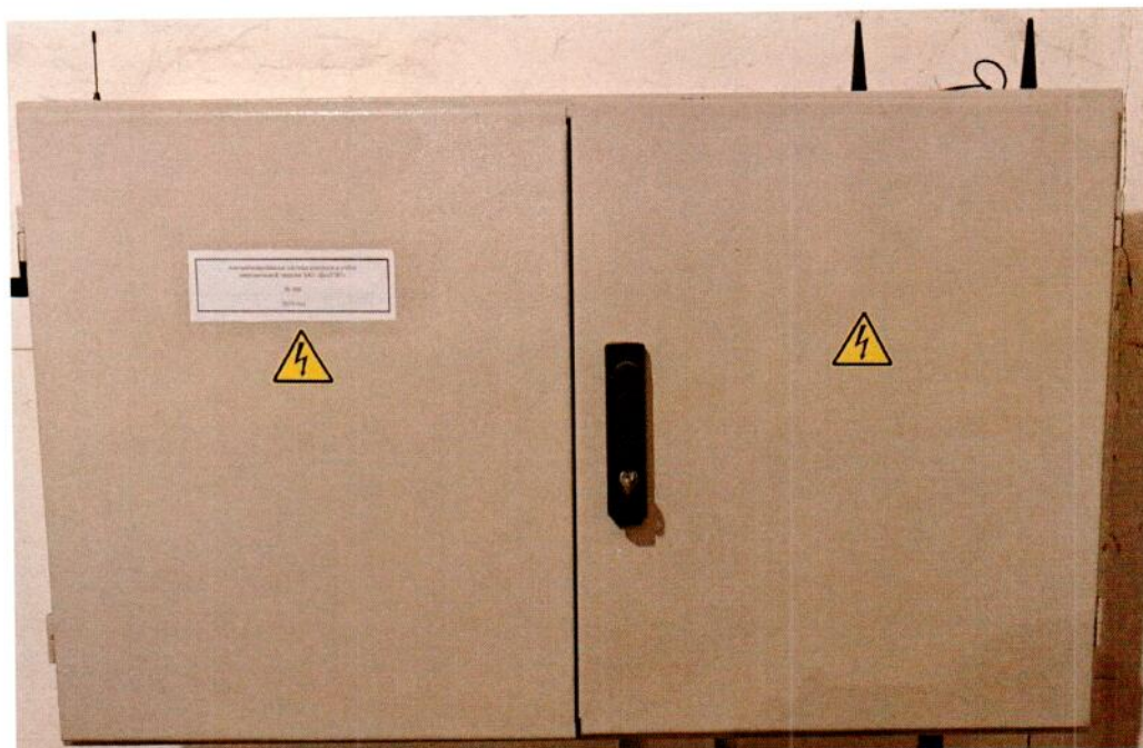
а) шкаф АСКУЭ