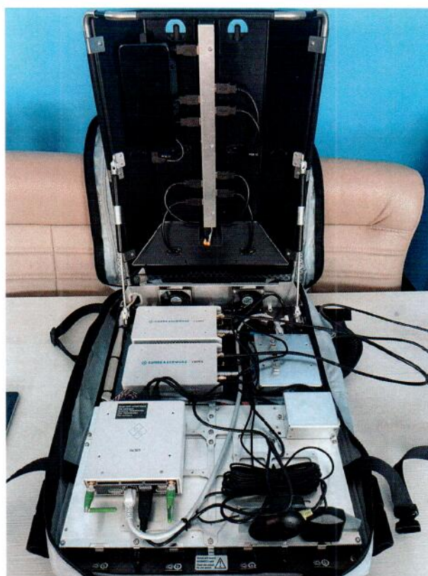
Рисунок 1.1 – Фотографии общего вида носимого измерительного комплекса для анализа параметров качества обслуживания сетей связи R&S Freerider 4 № NCM40100984