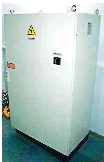
станция управления установкой