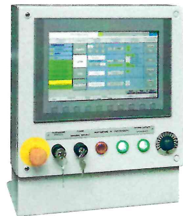
пульт ручного управления