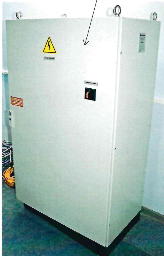
Рисунок 2.1 – Схема (рисунок) с указанием места для нанесения знака поверки средств измерений

Место для нанесения знака поверки средств измерений (передняя стенка станции управления установкой)