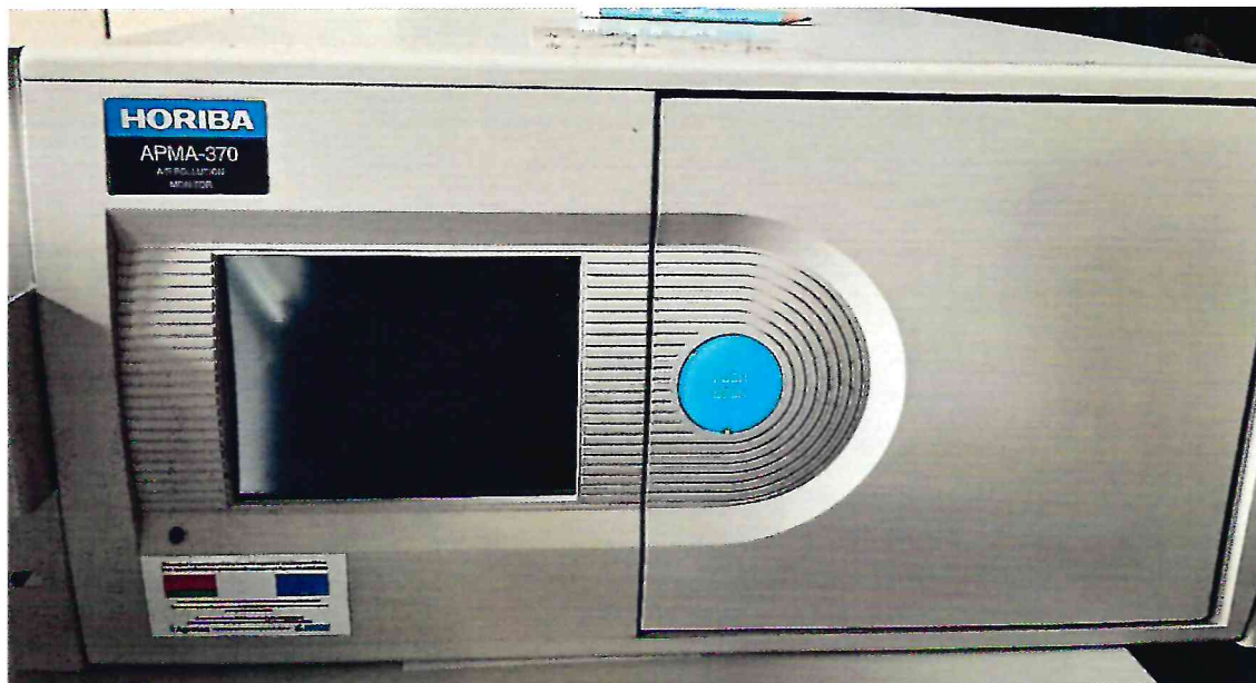
Рисунок 1.1 – Фотографии общего вида анализатора оксида углерода APMA-370 № 904689