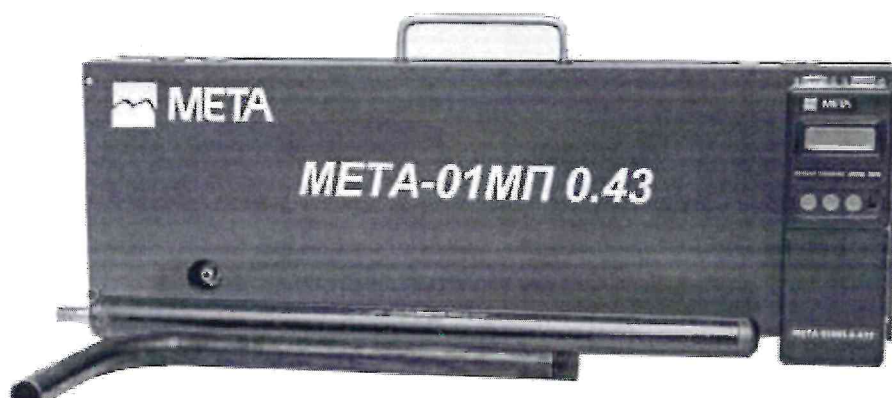
Рисунок 1б - Внешний вид измерителей дымности отработавших газов METА-01МП, модификации METА-01МП 0.43