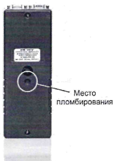
Рисунок 2 – Измерители дымности отработавших газов METА-01МП (вид сзади), обозначение мест пломбирования и маркировки.