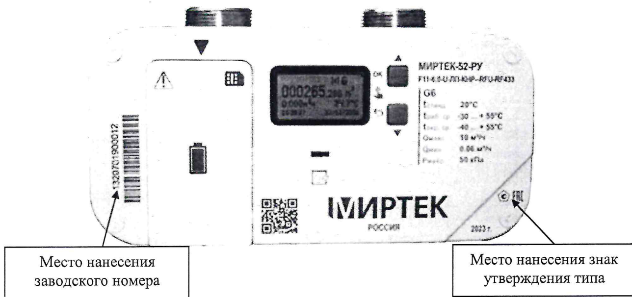
Рисунок 1 – Общий вид счетчиков

Общий вид счетчиков, место нанесения заводского номера, место нанесения знака утверждения типа представлены на рисунке 1.