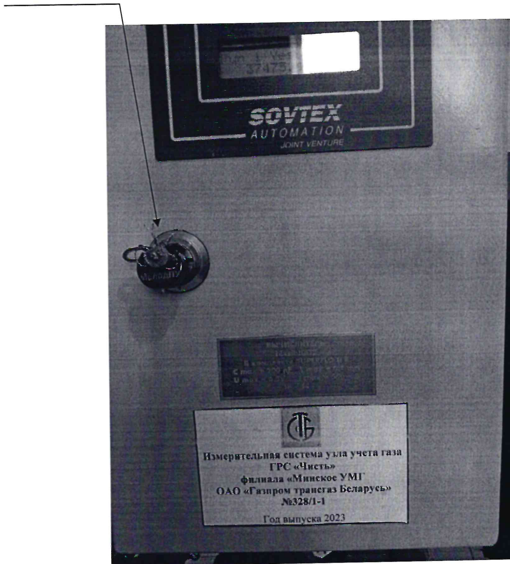
Рисунок 3.1 – Схема пломбировки от несанкционированного доступа

Место пломбировки от несанкционированного доступа