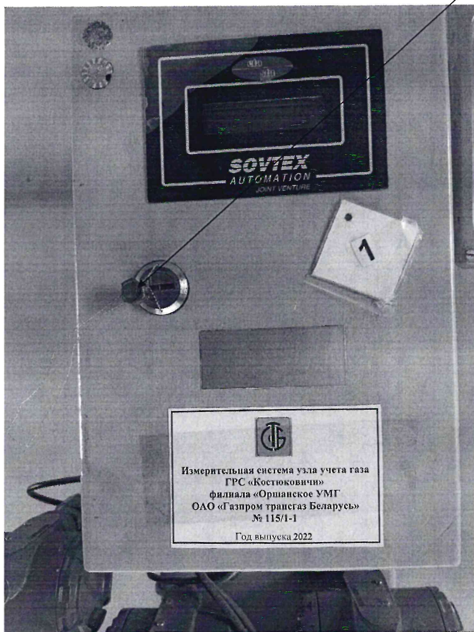
Рисунок 3.1 – Схема пломбировки от несанкционированного доступа

Место пломбировки от несанкционированного доступа