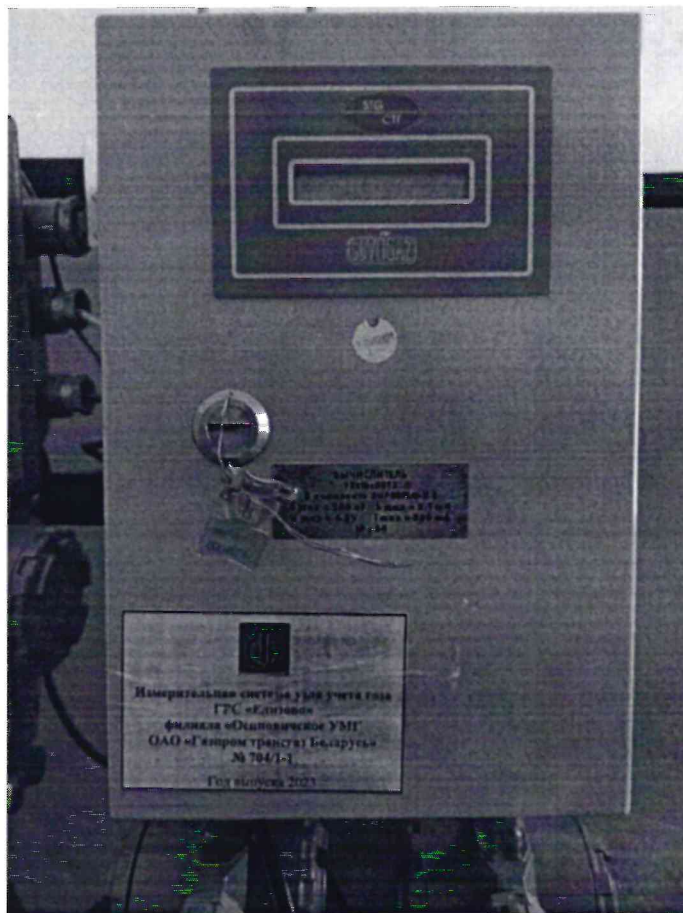
Рисунок 1.1 – Фотографии общего вида ИС УУГ