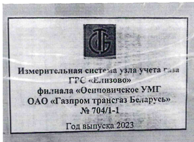
Рисунок 1.2 – Фотография маркировки ИС УУГ