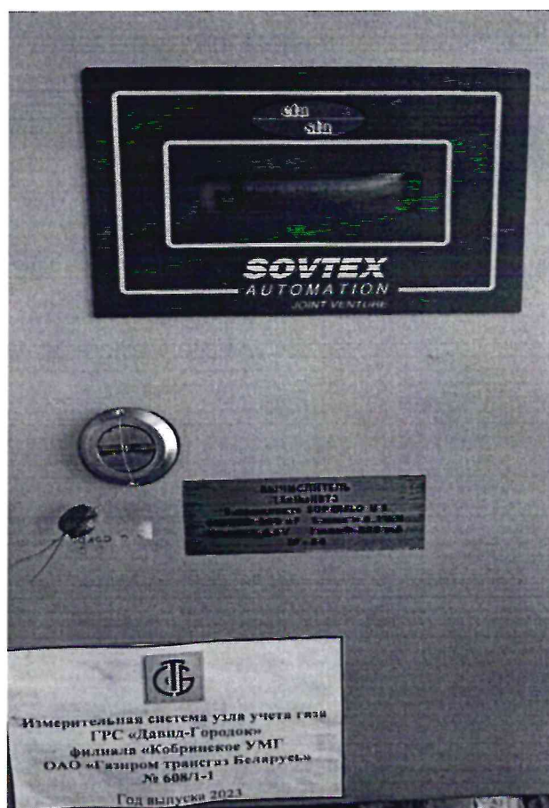
Рисунок 1.1 – Фотографии общего вида ИС УУГ