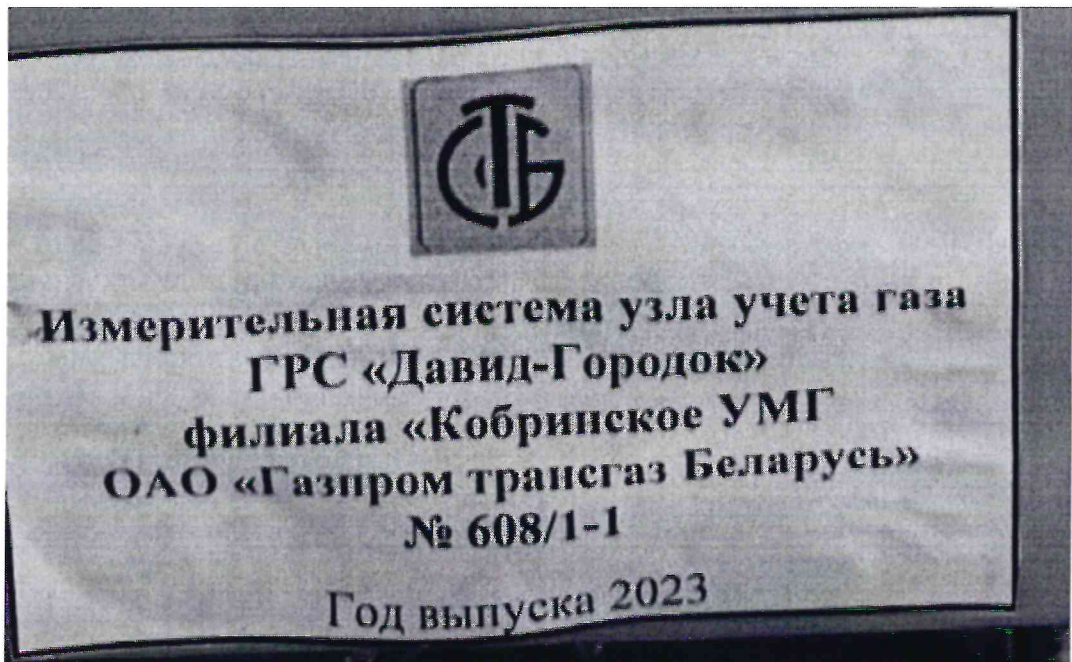
Рисунок 1.2 – Фотография маркировки ИС УУГ