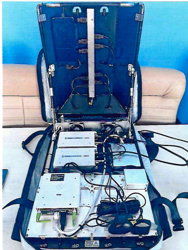
Рисунок 1.1 – Фотографии общего вида носимого измерительного комплекса для анализа параметров качества обслуживания сетей связи R&S Freerider 4 № NCM30100951