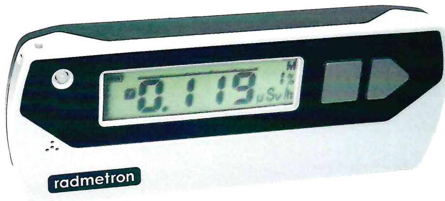
Рисунок 1.1 – Фотография общего вида дозиметров (изображение носит иллюстративный характер)