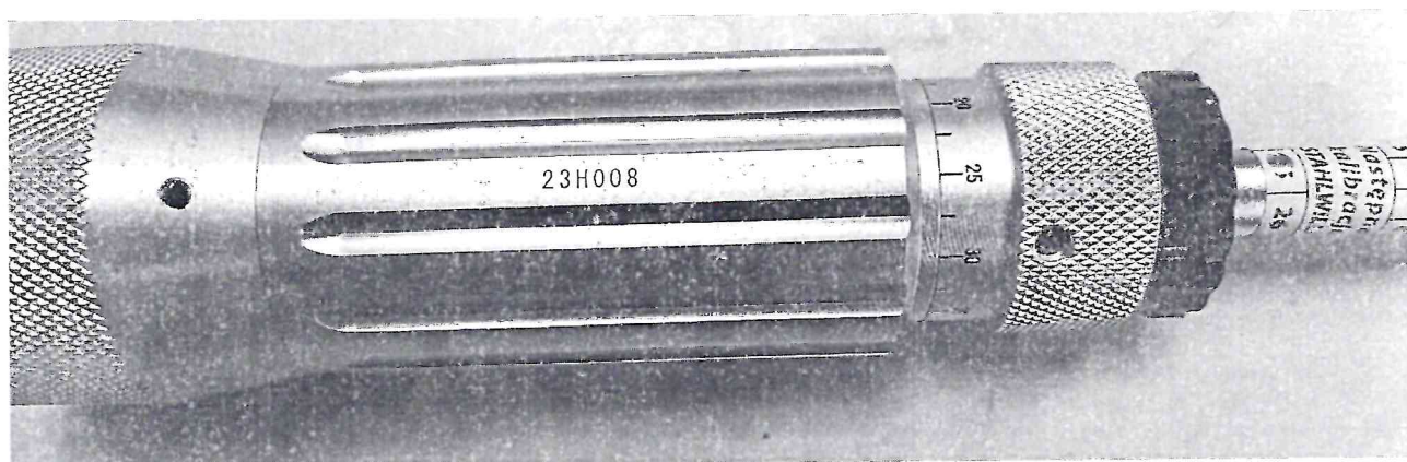
Рисунок 1.2 – Фотография маркировки отвертки динамометрической (моментной) 775/50 № 23H008