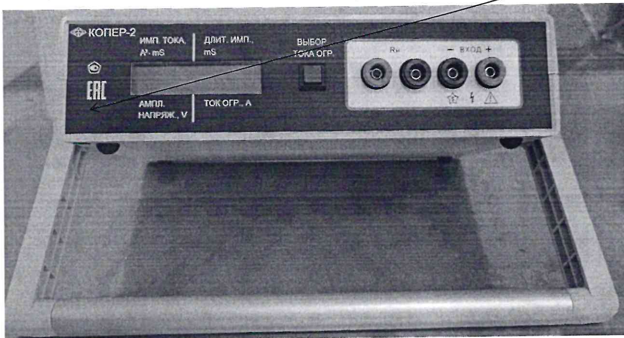
Рисунок 2.1 – Схема (рисунок) с указанием места для нанесения знака поверки средств измерений