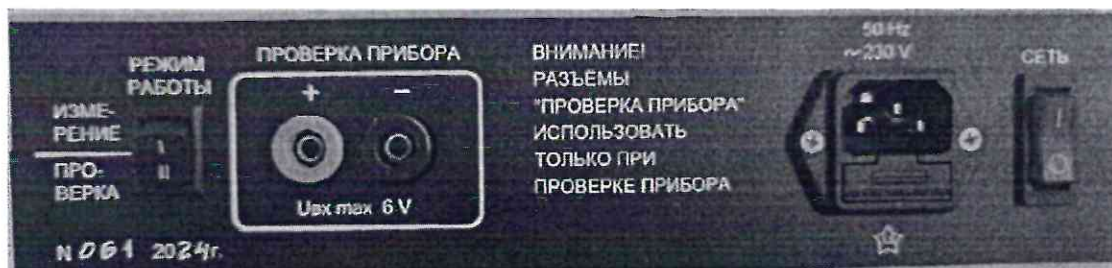
Рисунок 1.2 – Фотографии маркировки прибора измерения параметров электрических средств взрывания КОПЕР-2 № 061