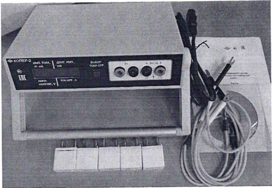
Рисунок 1.1 – Фотография общего вида прибора измерения параметров электрических средств взрывания КОПЕР-2 № 054