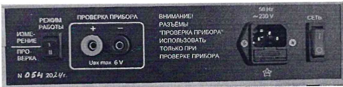
Рисунок 1.2 – Фотографии маркировки прибора измерения параметров электрических средств взрывания КОПЕР-2 № 054