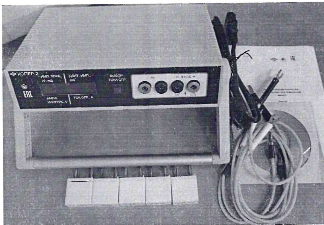
Рисунок 1.1 – Фотография общего вида прибора измерения параметров электрических средств взрывания КОПЕР-2 № 062