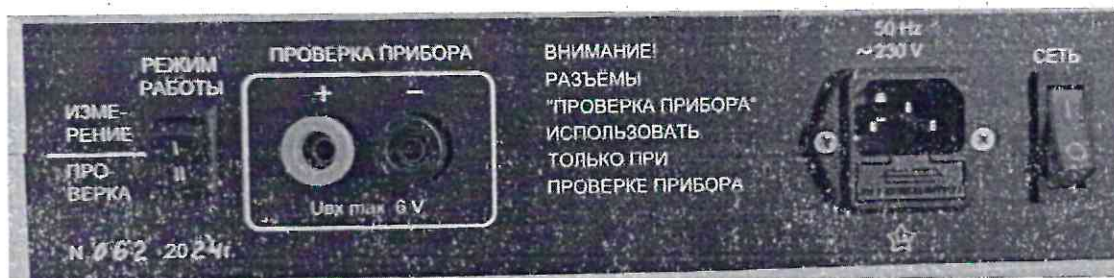
Рисунок 1.2 – Фотографии маркировки прибора измерения параметров электрических средств взрывания КОПЕР-2 № 062