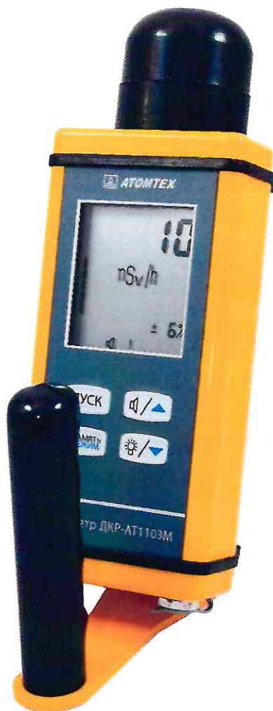
Рисунок 1 – Внешний вид дозиметра

Внешний вид дозиметра приведен на рисунке 1.