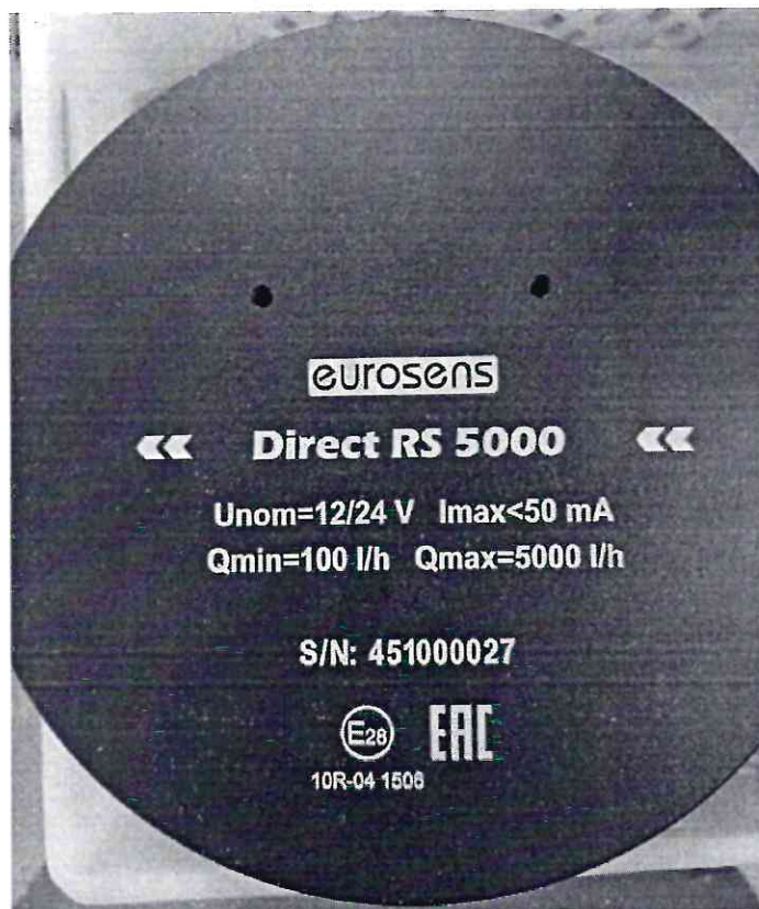
Рисунок 1.6 – Внешний вид счетчиков дизельного топлива EUROSENS Direct Y 5000 V (изображение носит иллюстративный характер)