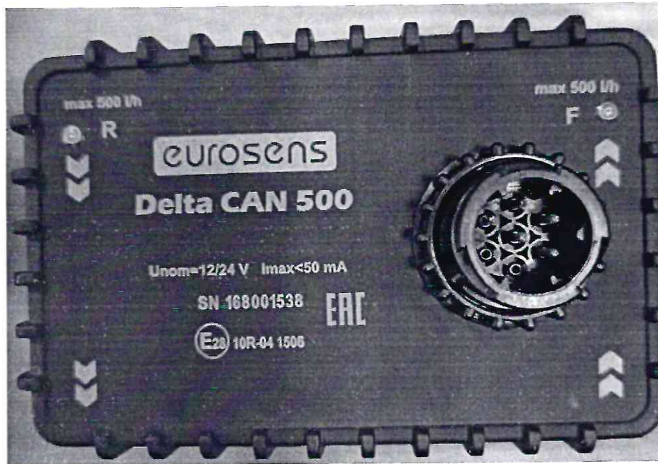
Рисунок 1.9 – Внешний вид счетчиков дизельного топлива EUROSENS Delta Y 500 V (изображение носит иллюстративный характер)