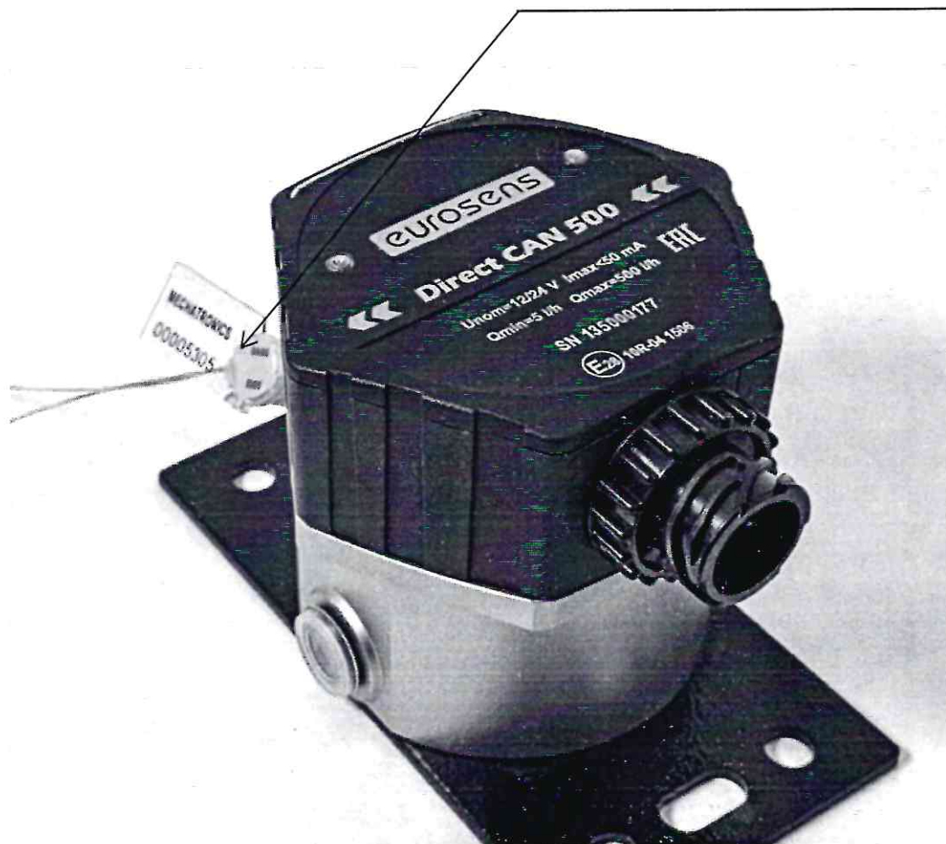
Рисунок 2.1 – Схема (рисунок) с указанием места для нанесения знака поверки средств измерений