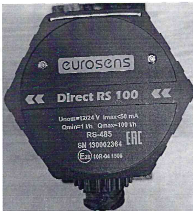
Рисунок 1.1 – Внешний вид счетчиков дизельного топлива EUROSENS Direct Y 100 V (изображение носит иллюстративный характер)