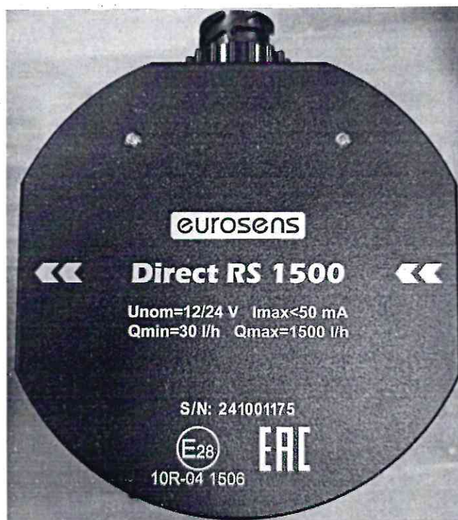
Рисунок 1.4 – Внешний вид счетчиков дизельного топлива EUROSENS Direct Y 1500 V (изображение носит иллюстративный характер)