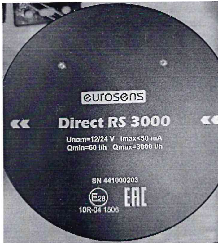
Рисунок 1.5 – Внешний вид счетчиков дизельного топлива EUROSENS Direct Y 3000 V (изображение носит иллюстративный характер)