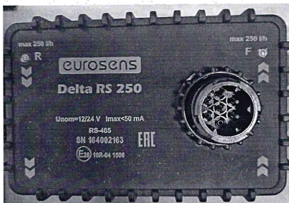
Рисунок 1.8 – Внешний вид счетчиков дизельного топлива EUROSENS Delta Y 250 V (изображение носит иллюстративный характер)