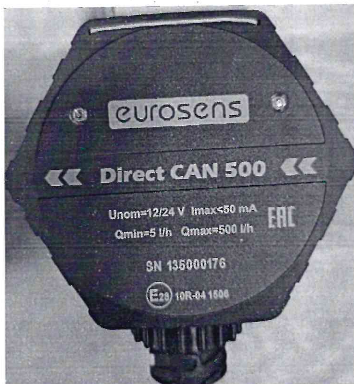
Рисунок 1.3 – Внешний вид счетчиков дизельного топлива EUROSENS Direct Y 500 V (изображение носит иллюстративный характер)