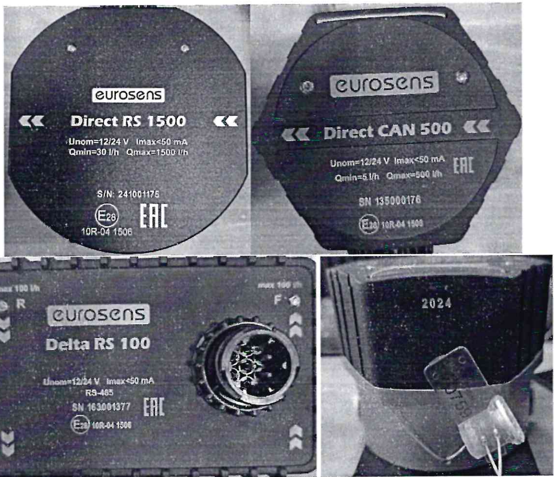
Рисунок 1.10 – Фотографии маркировки счетчиков дизельного топлива EUROSENS (изображение носит иллюстративный характер)