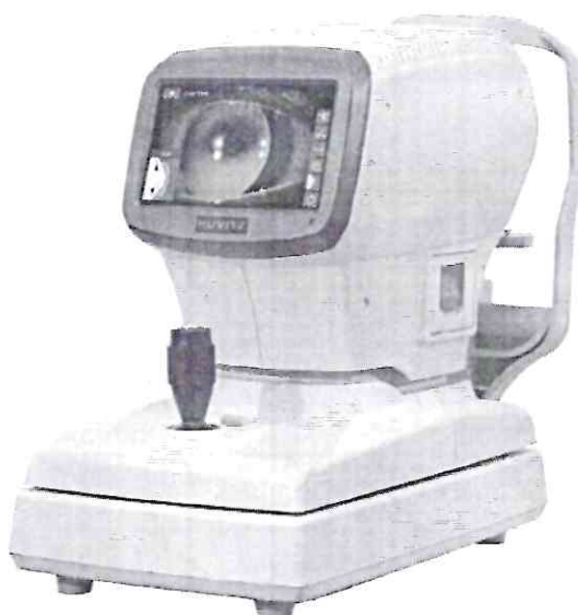
Рисунок 4 – Внешний вид авторефрактометра HRK-1.