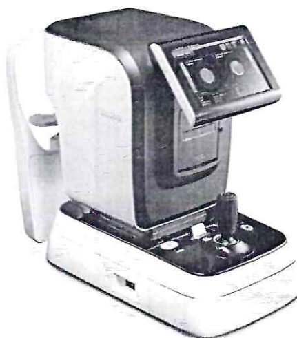
Рисунок 2 – Внешний вид авторефрактомерометра HRK-8000A.