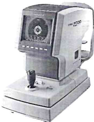
Рисунок 1 – Внешний вид авторефрактомерометра HRK-7000A.

Внешний вид авторефрактомерометров представлен на рисунках 1-4.