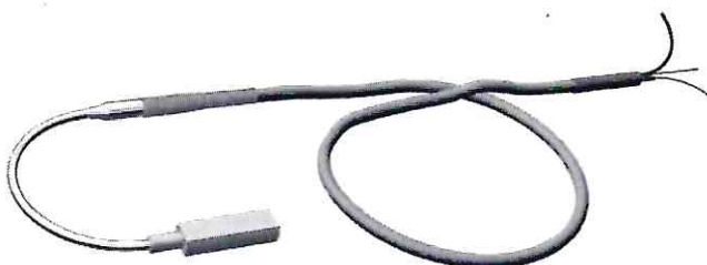
Конструктивная модификация 02.34