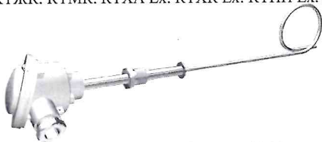
Конструктивная модификация 01.03

Внешний вид некоторых модификаций датчиков температуры КТХА, КТХК, КТНН, КТЖК, КТМК, КТХА Ех, КТХК Ех, КТНН Ех, КТЖК Ех, КТМК Ех приведены на рисунке 1.