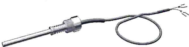
Конструктивная модификация 02.03