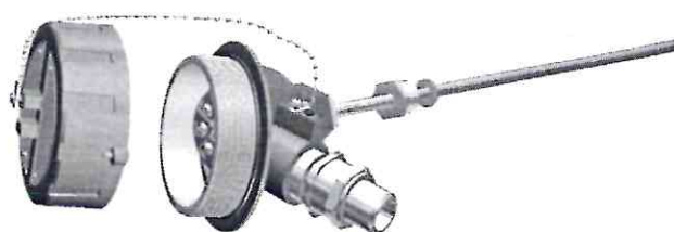
Конструктивная модификация 01.10