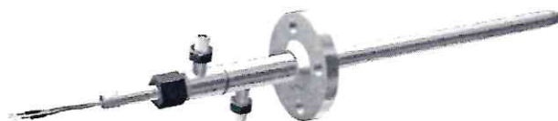
Конструктивная модификация 01.31