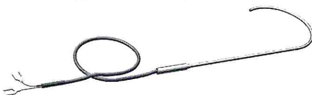
Конструктивная модификация 02.01