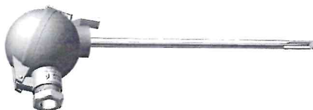
Конструктивная модификация 01.05