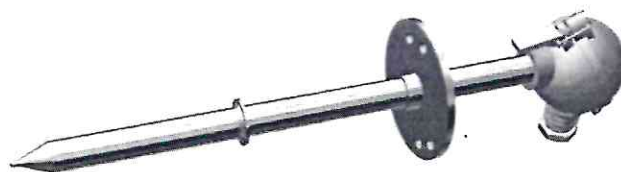
Конструктивная модификация 01.17