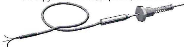
Конструктивная модификация 02.23