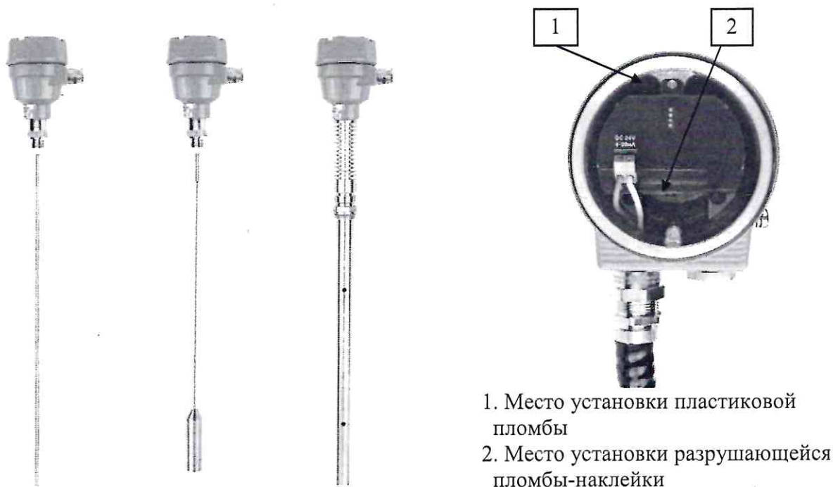
Рисунок 1 – Общий вид уровнемеров с указанием места пломбировки