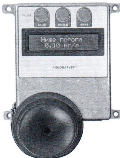
Рисунок 1 – Общий вид газоанализаторов АЛКОБАРЬЕР исполнения АЛКОБАРЬЕР, АЛКОБАРЬЕР-01

Общий вид газоанализаторов представлен на рисунке 1.