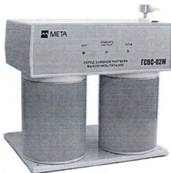
Рисунок 2 – Внешний вид генераторов ГСВС-МЕТА-02М