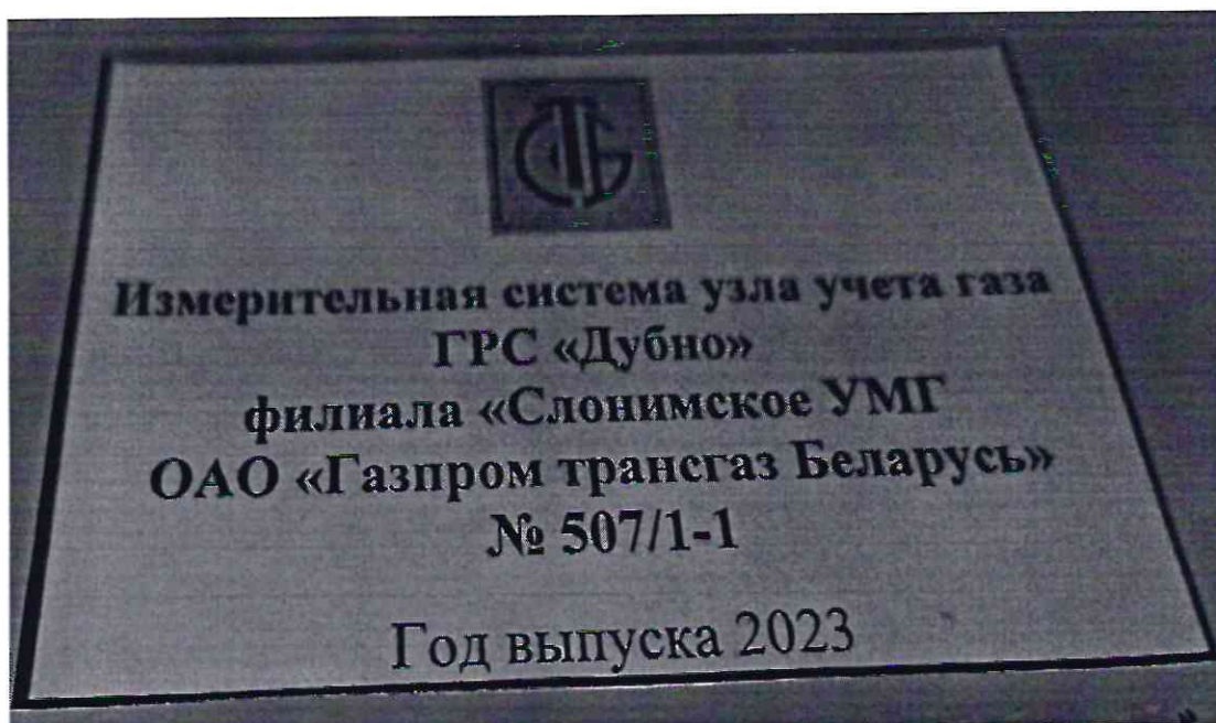
Рисунок 1.2 – Фотография маркировки ИС УУГ