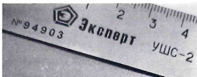
Рисунок 1.2 – Фотография маркировки универсального шаблона сварщика УШС-2 № 94903