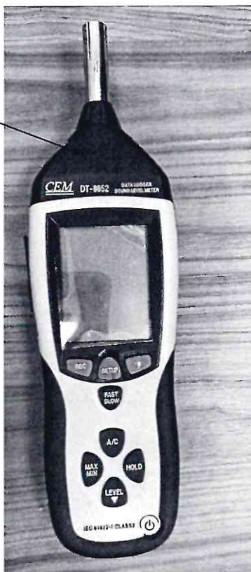
Рисунок 2.1 – Схема (рисунок) с указанием места для нанесения знака поверки