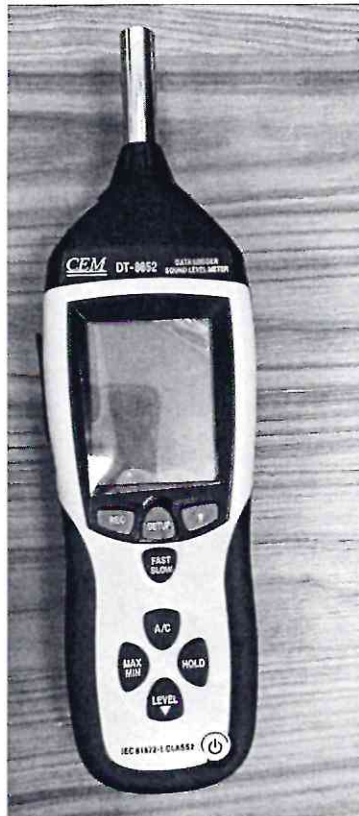
Рисунок 1.1 – Фотография общего вида измерителя уровня звука DT-8852 № 150301767