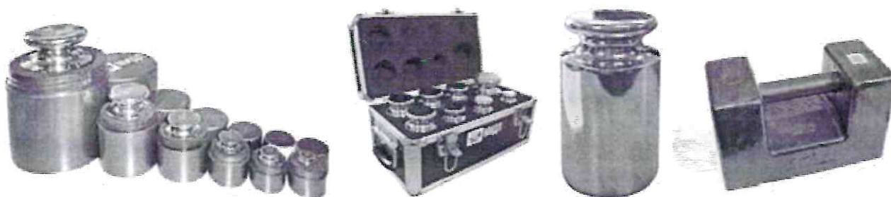
Рисунок 1 – Общий вид гирь

Маркировка гирь соответствует требованиям ГОСТ OIML R 111-1–2009.