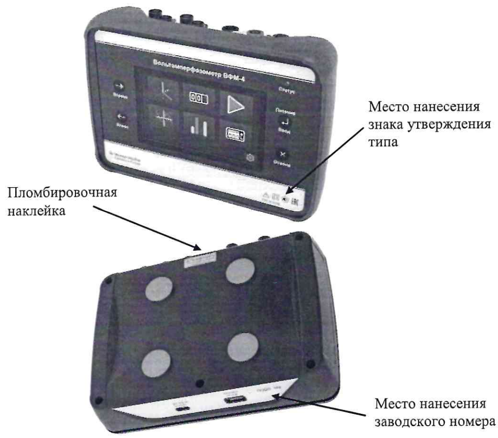
Рисунок 1 – Внешний вид ЭБ ВФМ-4