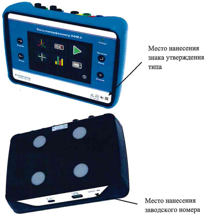
Рисунок 1.1 – Внешний вид вольтамперфазометра ВФМ-4 с местами нанесения знака утверждения типа и заводского номера