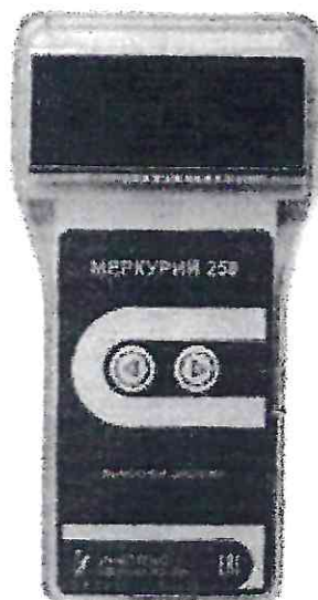
Рисунок 2 – Общий вид выносного дисплея Меркурий 258