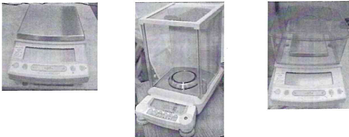
Рисунок 1 - Общий вид весов

Для защиты весов от несанкционированной настройки и вмешательства, которые могут привести к искажению результатов измерений, корпус весов пломбируется контрольной 1 ой этикеткой изготовителя, приведенной на рисунке 2.