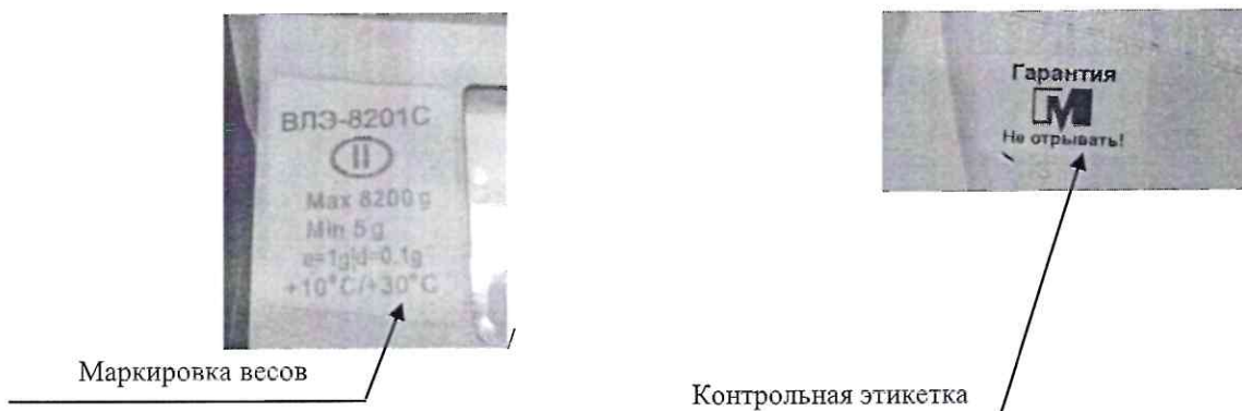
Рисунок 2 - Схема пломбирования от несанкционированного доступа и маркировка весов

Маркировка весов содержит следующие сведения: