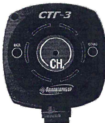
Рисунок 1 - Внешний вид сигнализатора

Схема пломбировки от несанкционированного доступа приведена на рисунке 2.