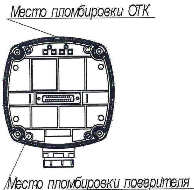
Рисунок 2 - Схема пломбировки сигнализаторов от несанкционированного доступа