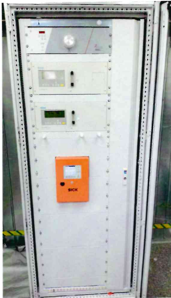
Рисунок 1.7 – Фотография шкафа приборного АСКВ