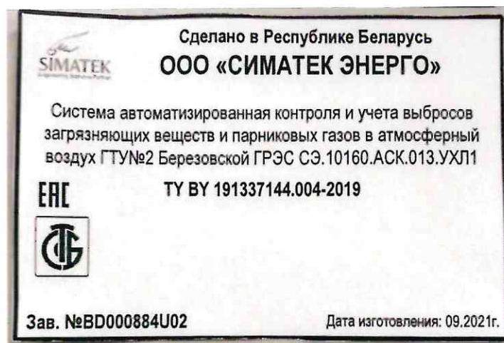
Рисунок 1.8 – Фотография маркировки АСКВ