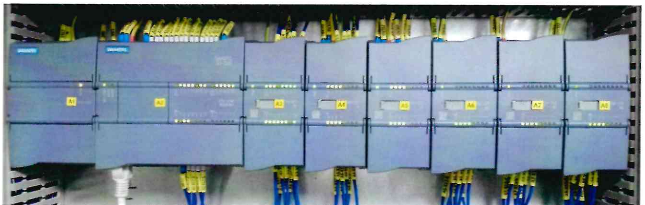
Рисунок 1.6 – Фотография контроллера программируемого SIMATIC S7-1200 с модулями ввода