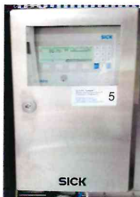
Рисунок 1.2 – Фотография газоанализатора ZIRKOR200