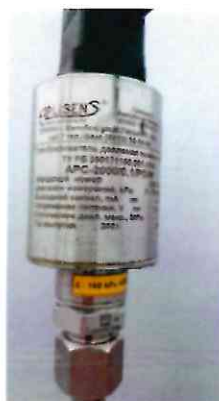
Рисунок 1.3 – Фотография преобразователя давления измерительного APC-2000