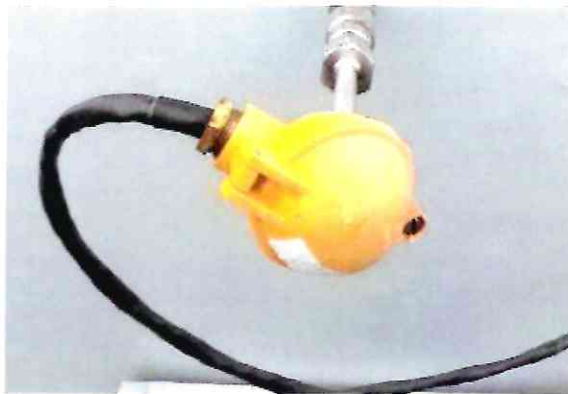
Рисунок 1.4 – Фотография преобразователя термоэлектрического СТР