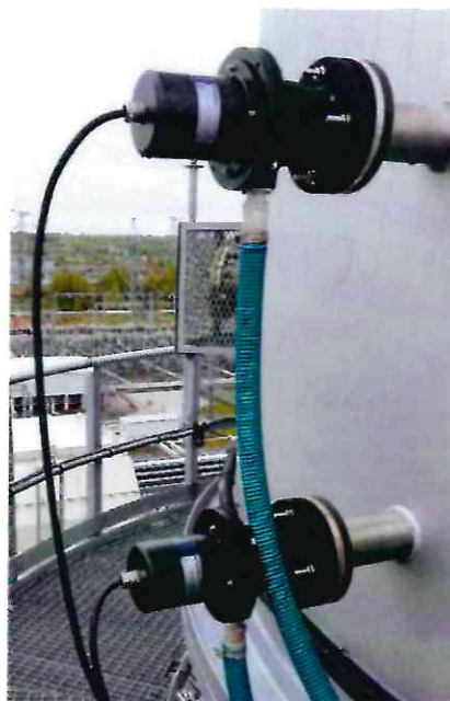
Рисунок 1.5 – Фотография измерителя скорости газоздушных потоков инфракрасного VSEM 5100