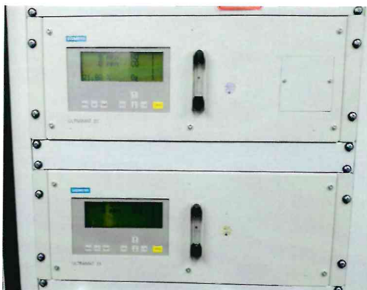
Рисунок 1.1 – Фотография газоанализаторов ULTRAMAT 23

Фотографии общего вида средства измерений