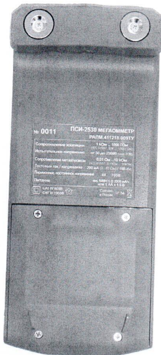
Рисунок 4 – Общий вид мегаомметров ПСИ-2530. Вид сзади