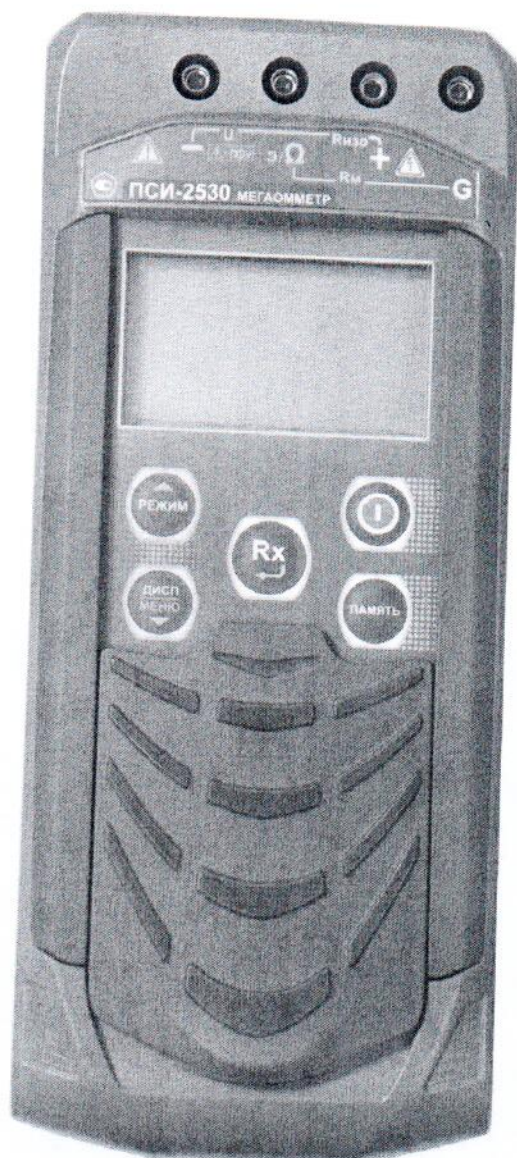
Рисунок 3 – Общий вид мегаомметров ПСИ-2530. Вид спереди