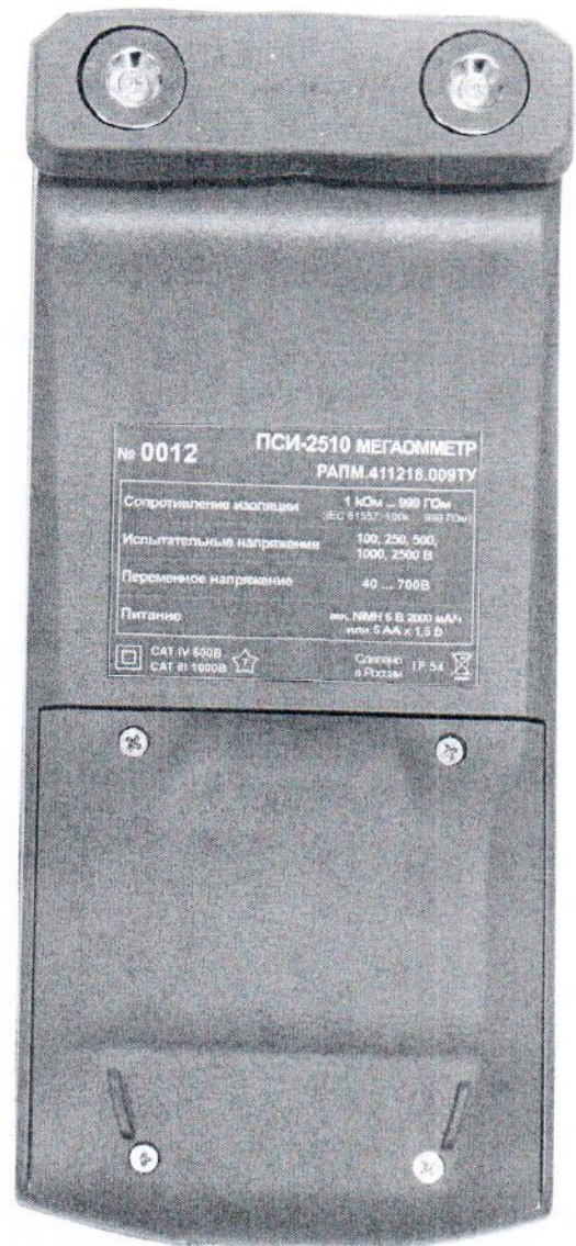
Рисунок 2 – Общий вид мегаомметров ПСИ-2510. Вид сзади