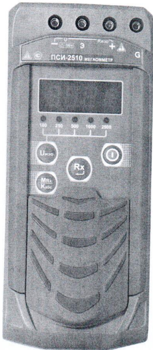
Рисунок 1 – Общий вид мегаомметров ПСИ-2510. Вид спереди

Общий вид мегаомметров представлен на рисунках 1 – 4. Схема пломбировки от несанкционированного доступа представлена на рисунке 5.