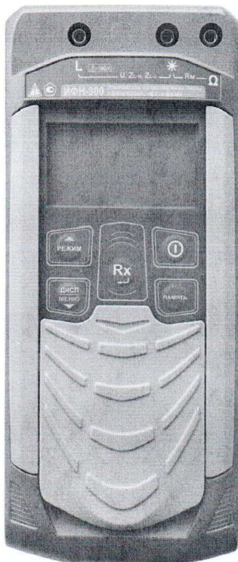
Рисунок 1 – Общий вид измерителей сопротивления петли «фаза-нуль», «фаза-фаза» ИФН-300. Вид спереди