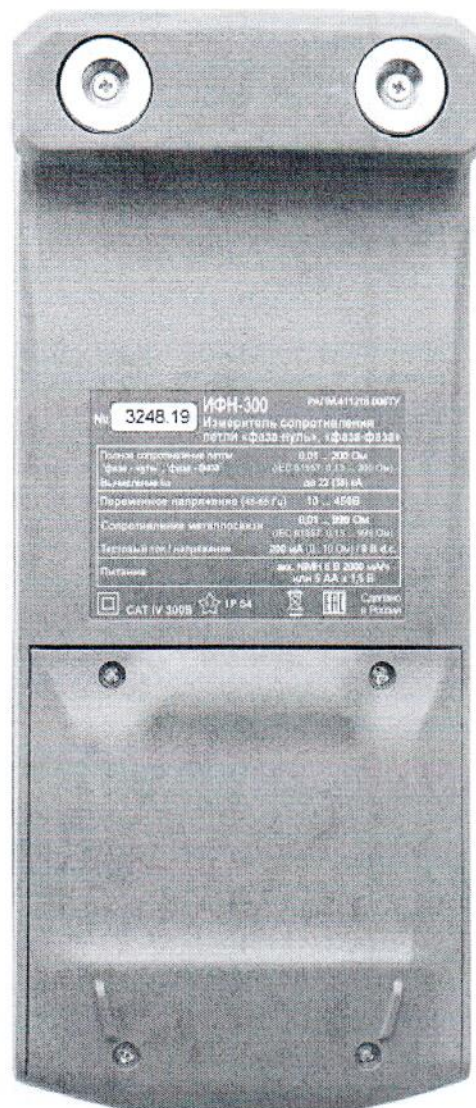
Рисунок 2 – Общий вид измерителей сопротивления петли «фаза-нуль», «фаза-фаза» ИФН-300. Вид сзади