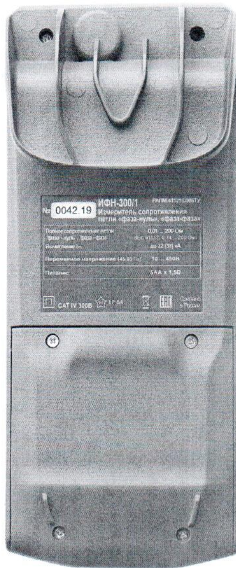
Рисунок 4 – Общий вид измерителей сопротивления петли «фаза-нуль», «фаза-фаза» ИФН-300/1. Вид сзади