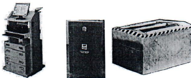
Рисунок 3 - Общий вид стендов силовых СТС-18-СП, СТС-20-СП