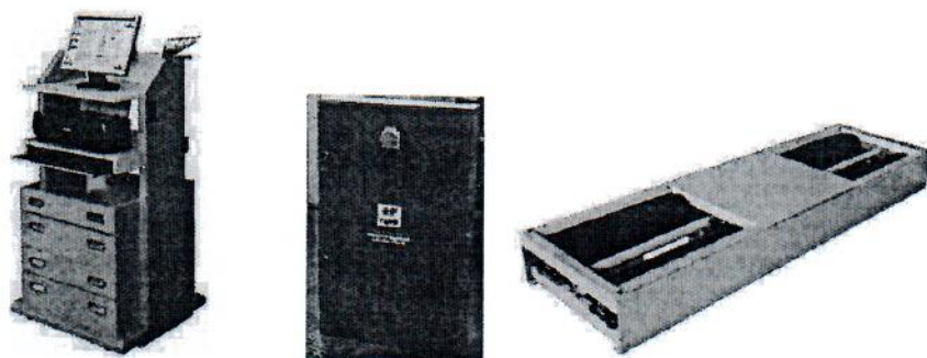
Рисунок 1 - Общий вид стендов силовых СТС-3-СП, СТС-3.5-СП, СТС-4-СП

Общий вид стендов силовых СТС приведён на рисунках 1-3.