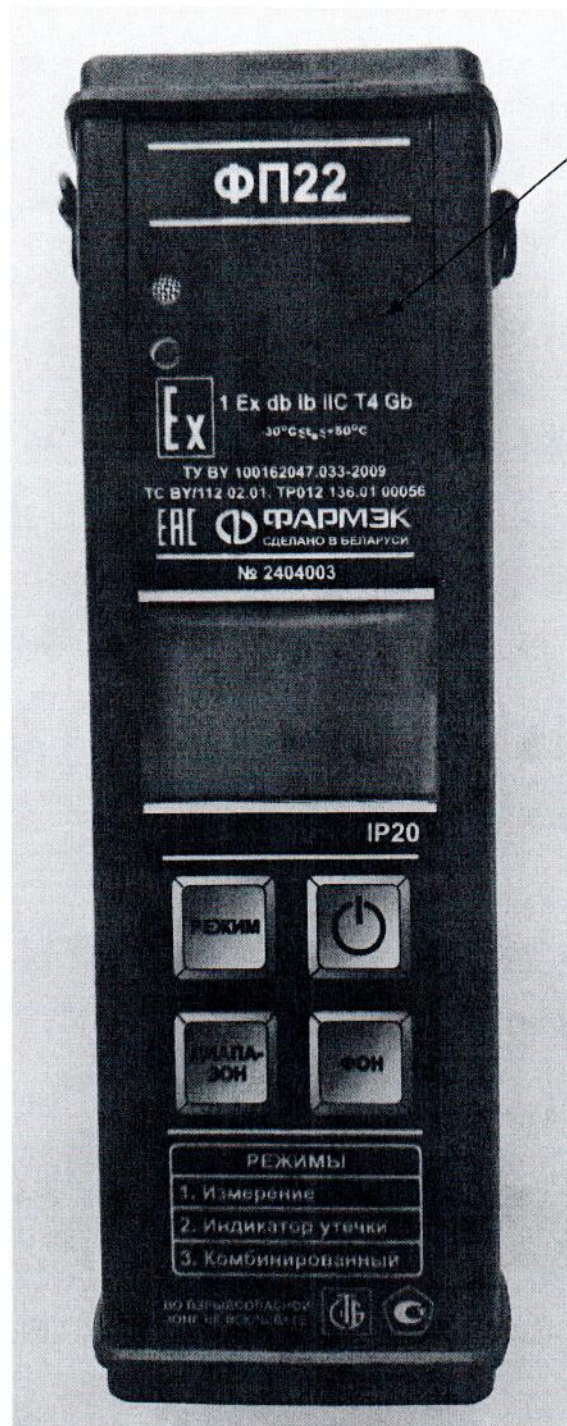
Рисунок 2.1 – Схема (рисунок) с указанием места для нанесения знака поверки средства измерений