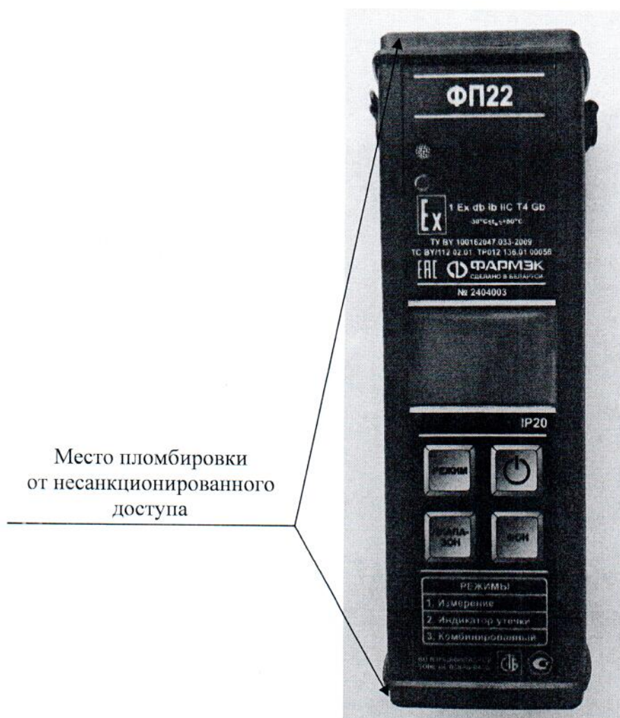
Рисунок 3.1 – Схема пломбировки от несанкционированного доступа