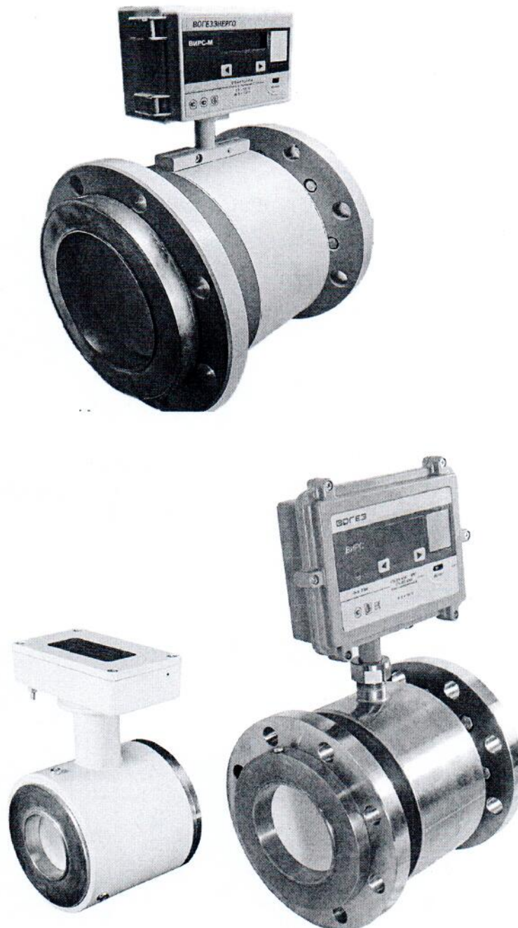
Рисунок 1.1 – Фотографии общего вида расходомеров-счетчиков электромагнитных ВИРС-М (изображение носит иллюстративный характер)