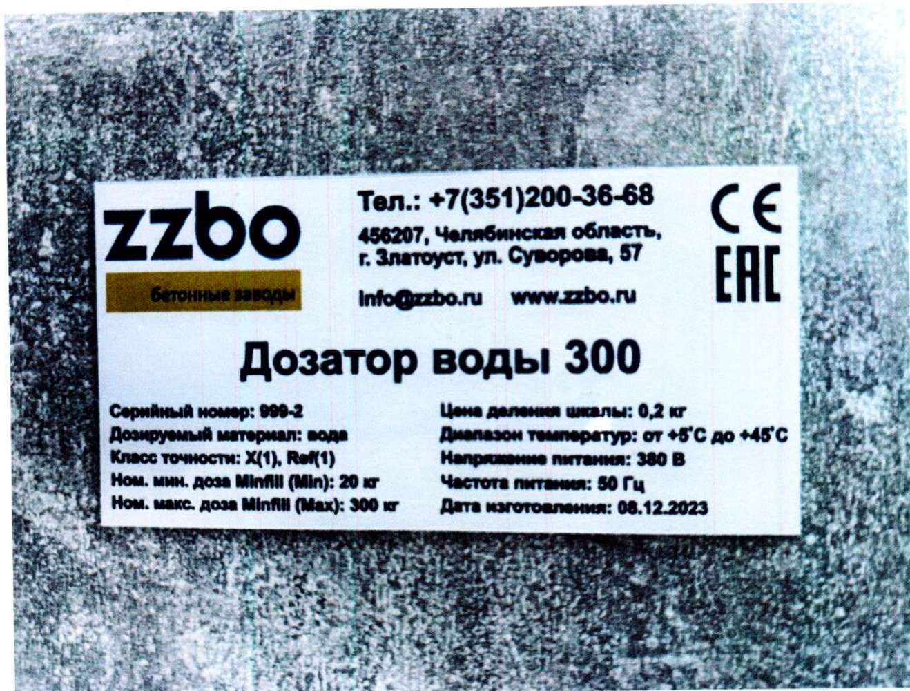
Рисунок 1.2 – Маркировка дозатора воды 300 № 999-2